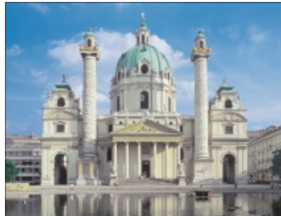
rakouské výtvarné umění, Johann Bernhard a Joseph Emanuel Fischer von Erlach: barokní kostel sv. Karla Boromejského ve Vídni (budován od r. 1716)