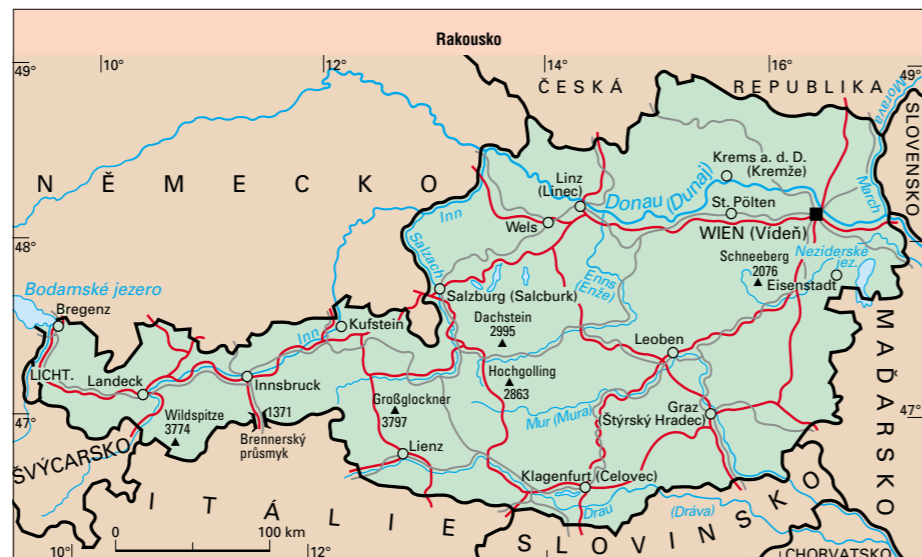
Rakousko, mapa rozdělení monarchie na nástupnické státy po první světové válce

ke kat. náb., muslimů je jen o málo méně než prot. Necelé 2/3 obyv. žijí ve městech, zdaleka nejvíce v hl. m. Vídni (Wien, 1,56 mil. obyv.).