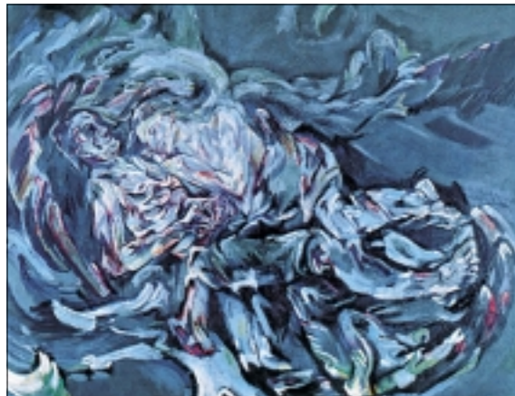
rakouské výtvarné umění, Oskar Kokoschka: Větrná nevěsta (1914). Basilej, Kunstmuseum