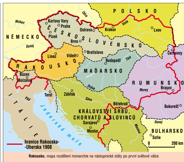
Rakousko, mapa rozdělení monarchie na nástupnické státy po první světové válce

R. má protažený tvar, jehož kostru tvoří Alpy a dopr. osu údolí Dunaje. Necelé 2/3 země zabírají Vých. Alpy. Skládají se z několika