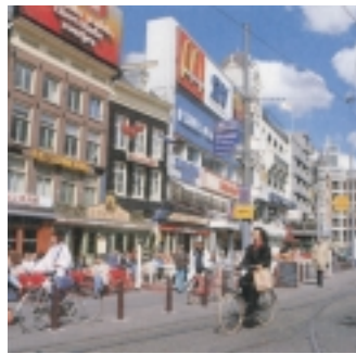
Nizozemsko, vlevo v hlavním městě Amsterdamu je jižní kolo nejoblíbenějším dopravním prostředkem; vpravo pěstování květin patří mezi nejvýznamnější hospodářská odvětví, země je hlavním dodavatelem květin v Evropě

Nóbrega Manuel da, port. kat. teolog, * 18. 10. 1517 již. Portugalsko, † 18. 10. 1570 Rio de Janeiro; zakladatel první jezuitské koleje v Braz.