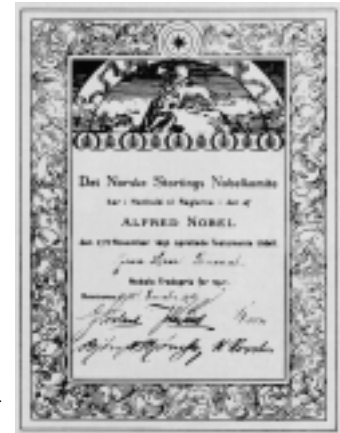
Nobelova cena, zakládací listina výboru pro udělení Nobelovy ceny (1901)

spolu s Nobelovou nadací Cenu za ekon. vědy na počest Alfreda Nobela, kt. propůjčuje švéd. AV ve stejné výši jako N. c. – N. c. sestává ze zlaté medaile a finančního příspěvku (asi 6,7 mil. švéd. korun za každou nerozdělenou cenu). První cena byla udělena 1901. Č. nositeli N. c. jsou prof. J. → Heyrovský (chem.) a básník J. → Seifert (lit.). ■